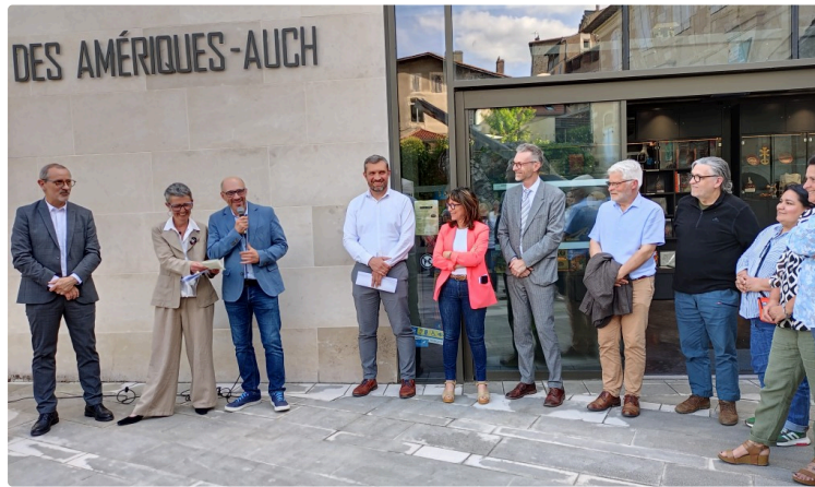
Le Musée des Amériques-Auch invite à l'exposition "Pérou précolombien : un regard sur le monde"

Une occasion de célébrer les liens inter-régionaux et faire découvrir l'héritage d'un monde perdu