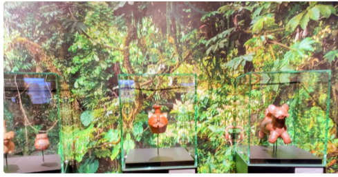
...poteries dans un climat amazonien