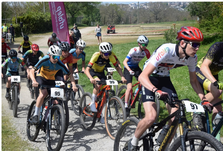
Le Gers brille au championnat régional de VTT XC en Aveyron

Le championnat régional de VTT cross-country s'est déroulé le week-end du 19 avril au Domaine de Combelle, à Rodez, en Aveyron, dans un cadre exceptionnel au cœur d'un magnifique domaine équestre.