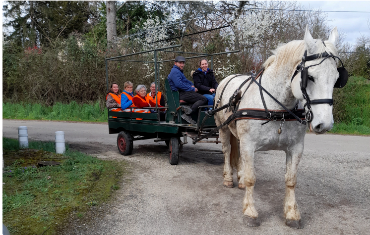
Vivre à Grazimis reçoit le Festival Arts des Rues'Raux

Le dimanche 30 mai, le hameau de Grazimis reçoit LE FESTIVAL DES ARTS DE RUES'RAUX, événement qui s'inscrit depuis quelques années dans les activités du service Culturel de la ville de Condom.