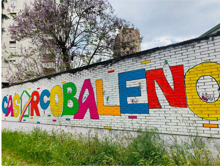
La Semaine au Campus Saint Christophe