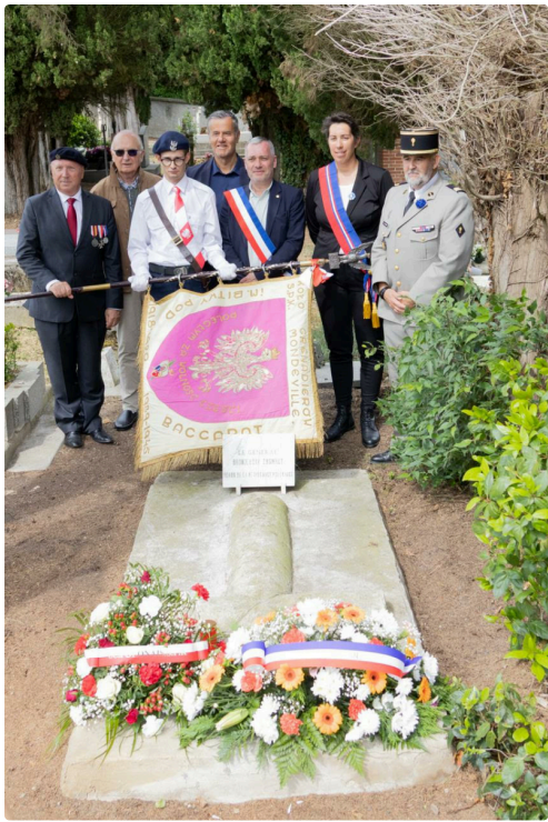
9 mai duran1.jpg