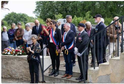
9 mai duran 2.jpg