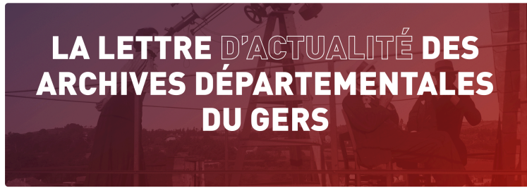
La lettre d'actualité des Archives départementales du Gers