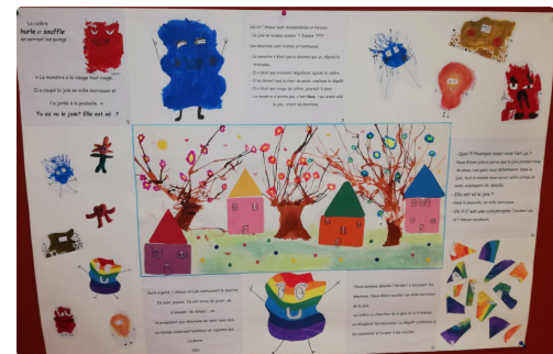
Fresque des écoliers miélanais, 2ème partie.