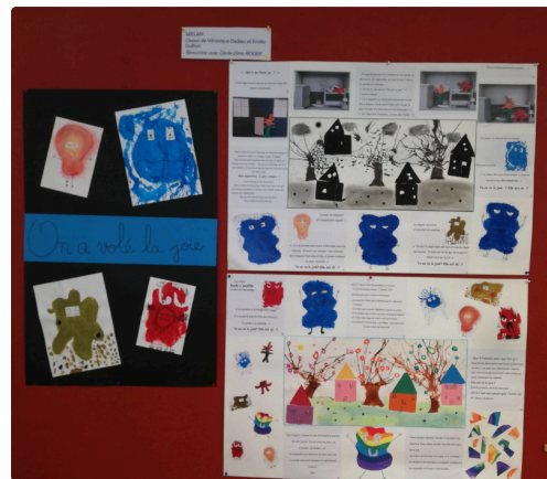
Fresque des écoliers miélanais, vue d'ensemble.

La fresque des écoliers miélanais est exposée à la médiathèque « Le Colisée » à Mirande.