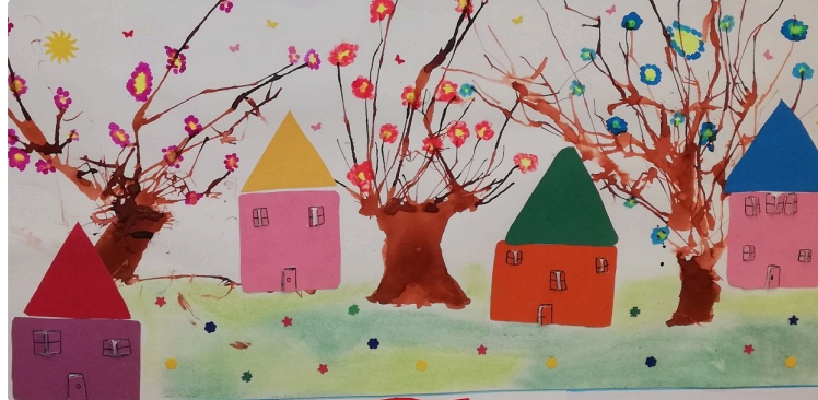
Les écoliers ont participé au salon du livre Jeunesse

Le 14ème salon du livre Jeunesse s'est déroulé à Mirande les 10 et 11 avril 2026 dans la salle André Daguin.