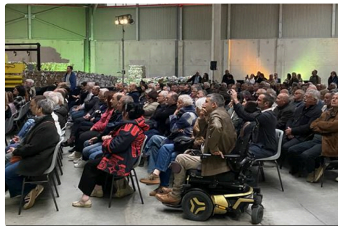
La salle affichait complet.