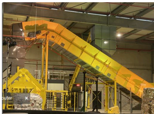
Un engin de traitement.