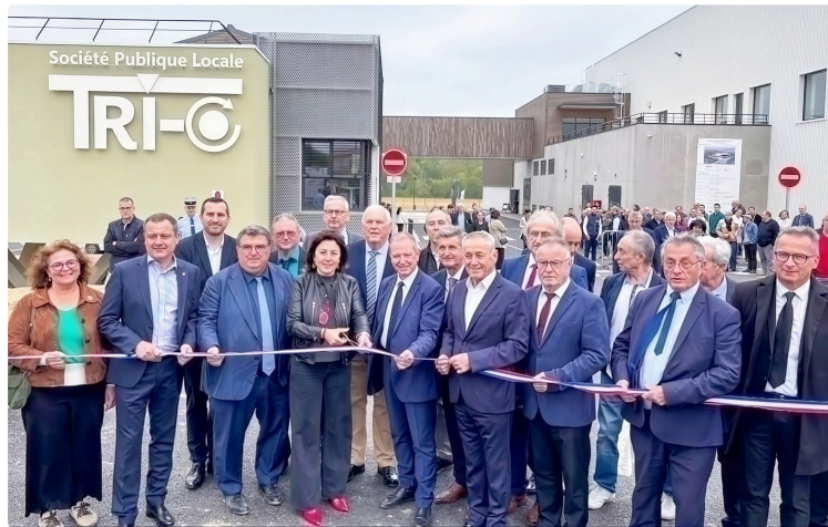
Le centre de tri interdépartemental inauguré

Un projet de haute technicité qui devrait traiter à terme 600 tonnes de déchets hebdomadaires soit 35 000 tonnes annuellement