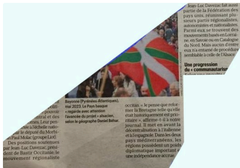
Extrait de l'article du Parisien du 10 avril 2026