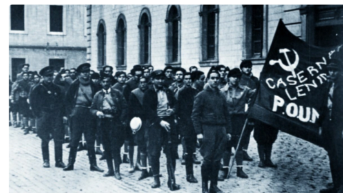
Hommage à la Catalogne (6).jpg