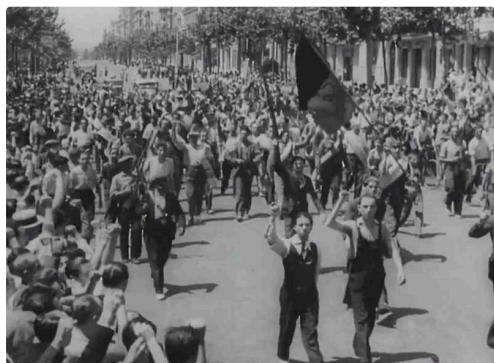
Hommage à la Catalogne (5).jpg

Fervent lecteur de l'ouvrage, le réalisateur découvre en 1977, à Barcelone, des films inédits tournés par la CNT dès 1936. En Catalogne, l'industrie cinématographique était aux mains des anarchistes. Les opérateurs de prise de vue, également acteurs de ces événements, avaient abondamment documenté la situation dont parle Orwell. Mais le film qu'il en tire aujourd'hui est plus qu'une simple adaptation ; c'est une rencontre entre ces images d'archive, chants révolutionnaires, créations musicales et une voix : celle de Denis Podalydès, lisant des passages du livre. HOMMAGE À LA CATALOGNE retrace l'engagement de Georges Orwell dans la révolution et la guerre d'Espagne, que Frédéric Goldbronn transforme ici en une véritable expérience de cinéma, en hommage aux vaincus.