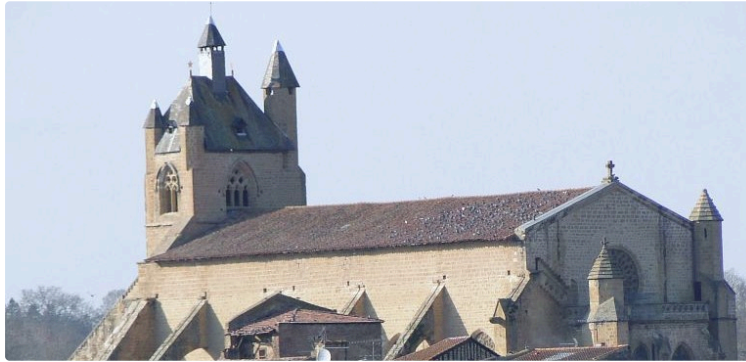
Annonces paroissiales du 11 au 19 mars 2026

Samedi 11 avril 2026 : Pèlerinage en famille à Lourdes.