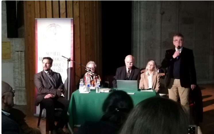
Société Archéologique du Gers, communications avril 2026