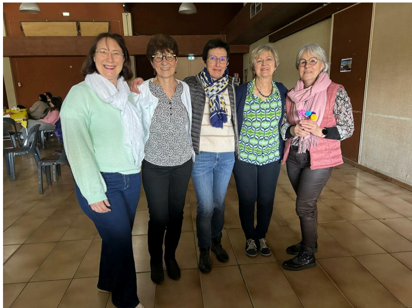
L'équipe locale de La Ligue contre le cancer