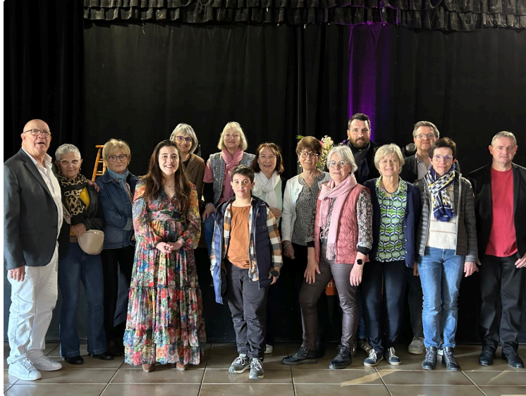
Deuxième édition réussie du concert solidaire au profit de la Ligue contre le cancer

C'est dans une salle polyvalente joliment décorée pour l'occasion que s'est déroulé, ce dimanche après-midi, un concert solidaire d'une grande chaleur humaine - à défaut de chauffage... - organisé au profit de la Ligue contre le cancer du Gers.