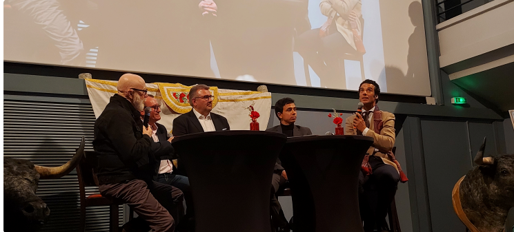
La Feria del Toro 2026 dévoilée lors d'une soirée dense et fidèle à l'esprit vicois