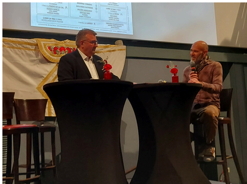
Cette affiche marque une nouvelle étape après les décennies de collaboration avec Jean-Paul Chambas.