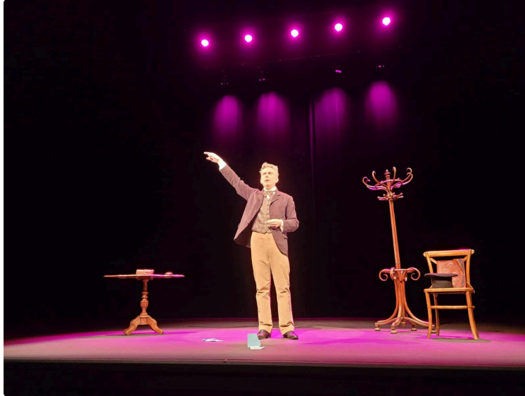
Prochaine soirée théâtre de In § Off : "Gustave Eiffel, en fer et contre tous"

Le samedi 11 avril 2026 à 21 heures, la salle polyvalente de Vic-Fezensac accueillera une nouvelle soirée organisée par IN&OFF, placée sous le signe du théâtre et de l'histoire.