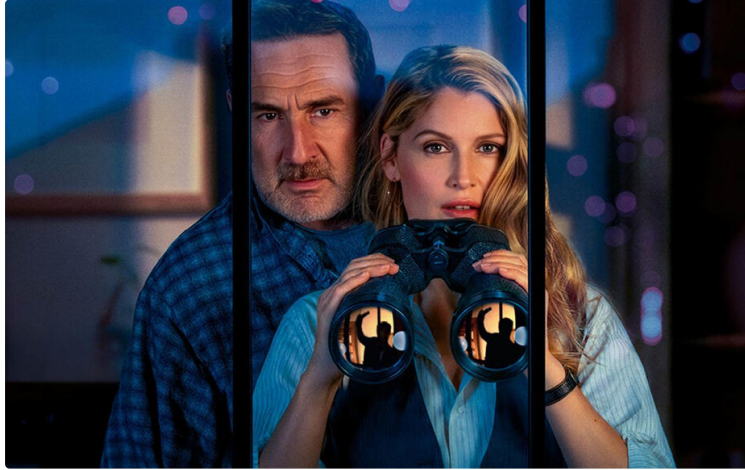
Animation, drame, thriller et comédie au programme de la semaine

Cette semaine, Cinequanon vous propose un programme varié pour petits et grands.