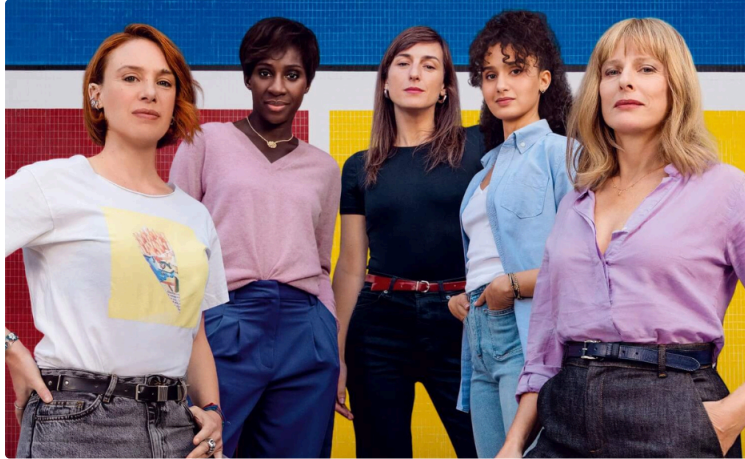
Drame, comédie, thriller et animation au programme de la semaine !

Cette semaine, Cinequanon vous propose :