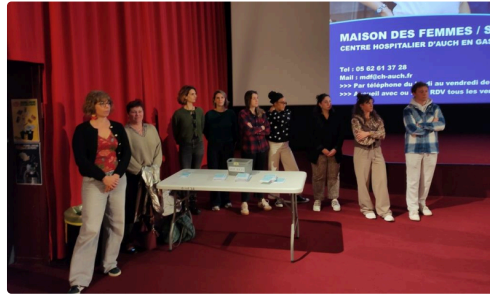
L'équipe de soignants