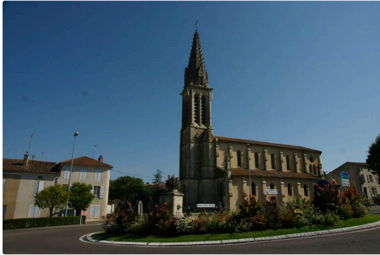
La saison 2026 de l'Espace Saint-Michel se prépare !

Avec l'arrivée du printemps, l'Espace Saint-Michel se prépare à vous accueillir pour une nouvelle saison artistique qui restera fidèle à ses objectifs : faire la promotion des artistes de la région, promouvoir la Culture et les arts plastiques en milieu rural, être un facteur d'éveil artistique auprès de la jeunesse et des scolaires.