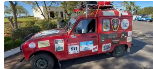
Capture d'écran 2026-02-23 190245.jpg