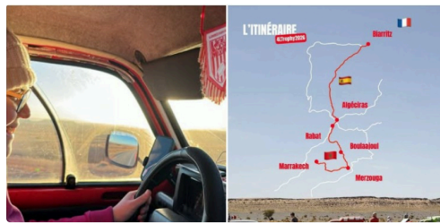
Capture d'écran 2026-02-23 191603.jpg