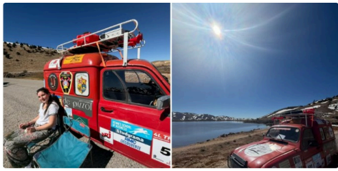
Capture d'écran 2026-02-23 191153.jpg