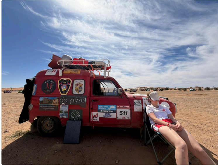
Les 4L du savès au Maroc