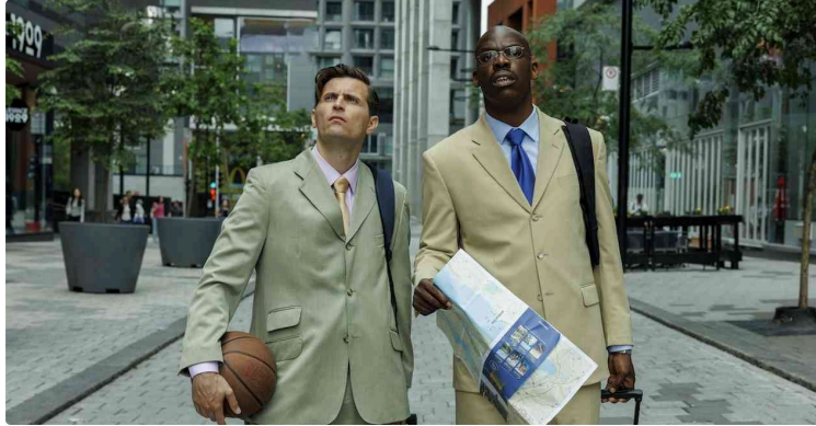
Cinequanon : le programme de la fin de vacances !

Deuxième semaine de vacances avec un programme varié !