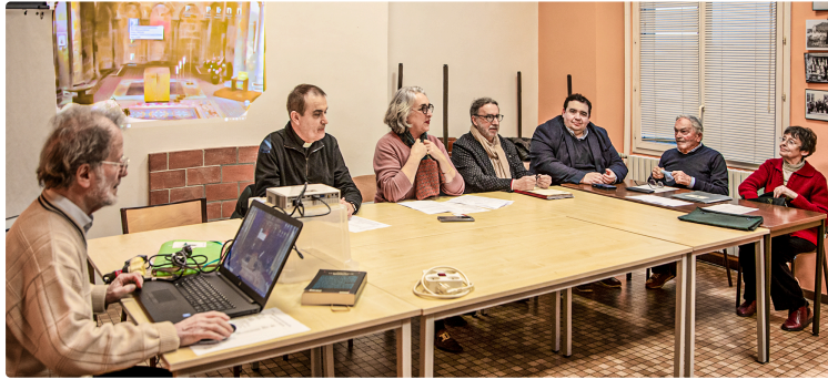
L'association Ancore préserve et met en valeur la collégiale de Nogaro

Elle veille sur elle et organise des animations