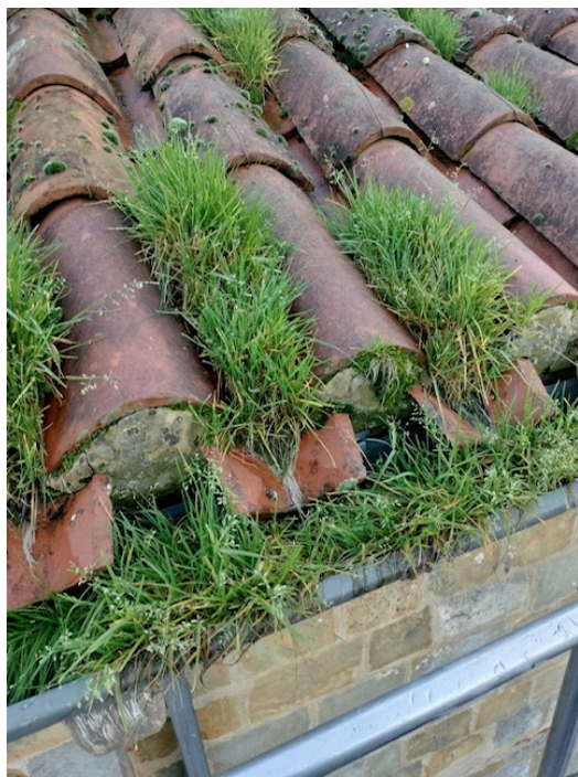
Tuiles en mauvais état

Par ailleurs, on attend la réparation du baptistère et d'une cloche, pour qu'elle puisse sonner à toute volée.