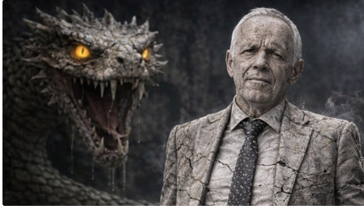
Le maire d'Auch victime du Basilic

Dans le cadre de la Quinzaine régionale des langues catalanes et occitanes « PARLEM ! » organisée du 16 février au 1er mars 2026 par la Région Occitanie, de nombreux événements sont proposés pour valoriser et faire vivre les langues régionales au quotidien. Parmi les initiatives dans le Gers, la Région, l'Office de Tourisme Grand Auch Cœur de Gascogne et les Francas du Gers s'associent pour relier tourisme et langues régionales.