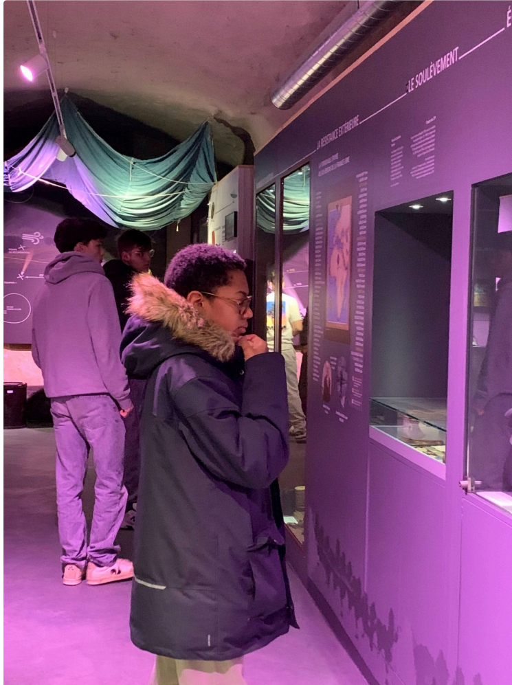
De la salle de classe au musée : sur les traces de l'Histoire

Avec deux classes du Campus Saint Christophe