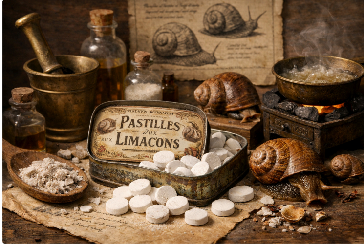
Les vertus de l'escargot de Barran, entre légende et pharmacopée gasconne

En cette fin de période hivernale, où les stocks de sirop contre la toux diminuent en pharmacie, intéressons-nous dans notre rubrique "Revenons sur nos pas" aux vertus thérapeutiques de l'escargot !