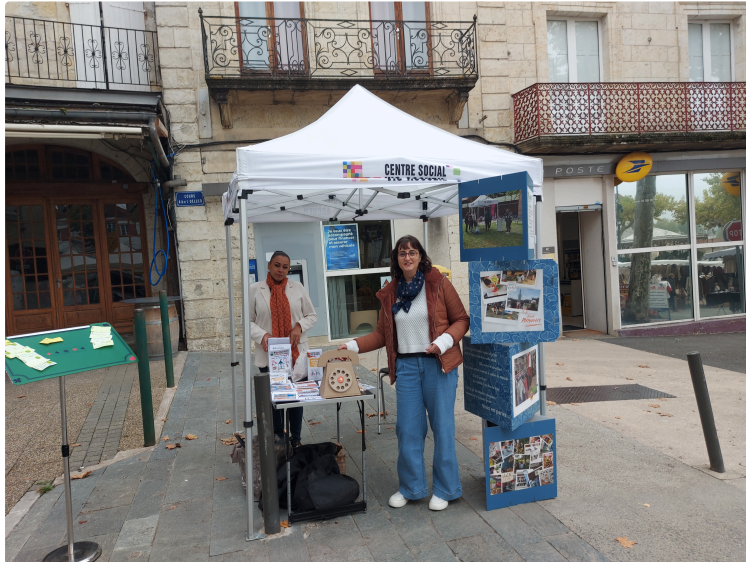
Vic-Accueil vient à votre rencontre !

A tous les habitants de Justian, Roques, Mourède et Bezolles