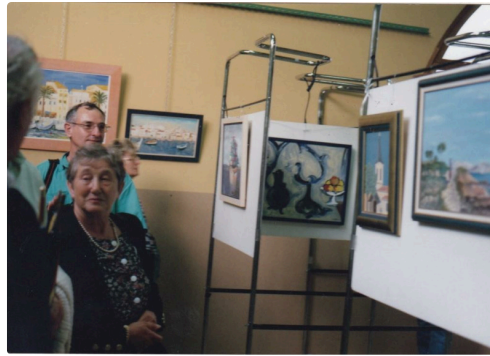
Lors d'une de ses nombreuses expositions