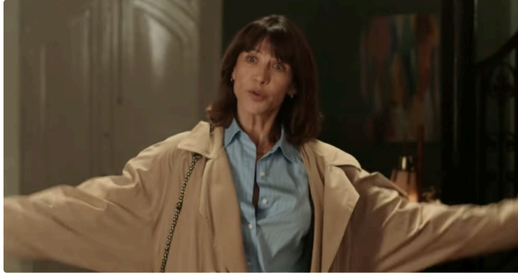
Cinequanon : le programme de la semaine

Il est toujours temps de prendre votre adhésion pour bénéficier de tarifs préférentiels et soutenir votre cinéma !