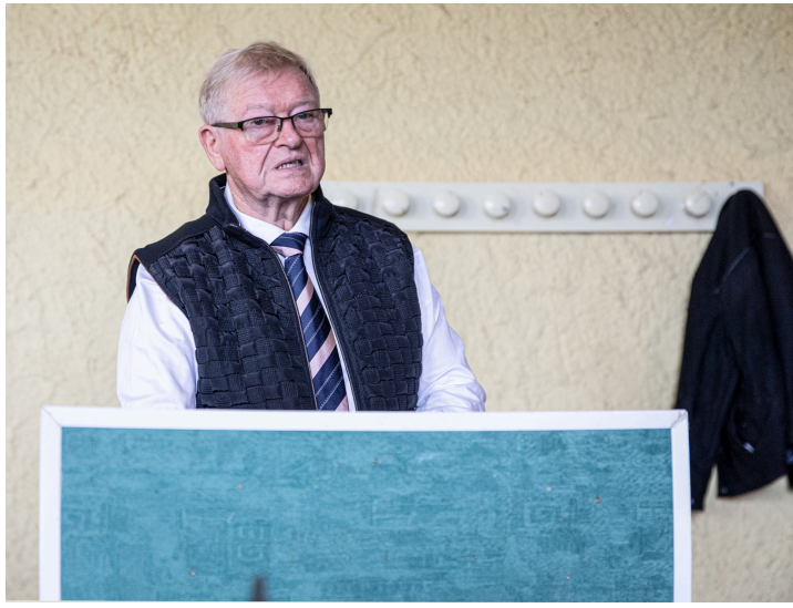
Jacques Tartas en 2024