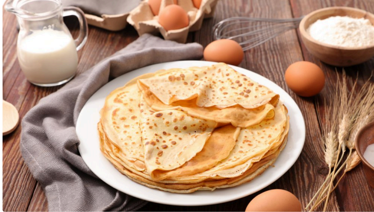
Les crêpes de la Chandeleur, exercice de haute voltige et légendes tenaces !

En ce jour de Chandeleur, nous vous proposons un texte extrait de l'ouvrage de Pierre Dupouy "Souvenirs du Gers d'autrefois" paru en mars 2025 aux éditions Sutton.