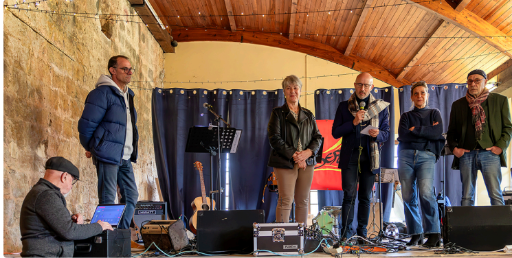
Bons vœux à Termes-d'Armagnac