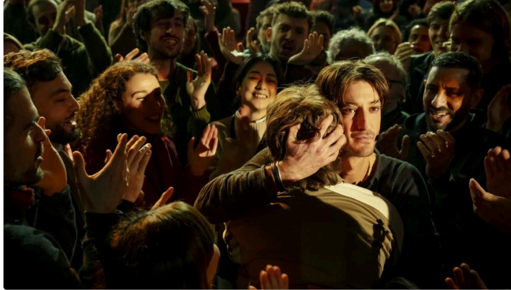
Cinequanon : le programme de la semaine

Cette semaine, animation, comédie, drame, thriller, des propositions pour tous les goûts !