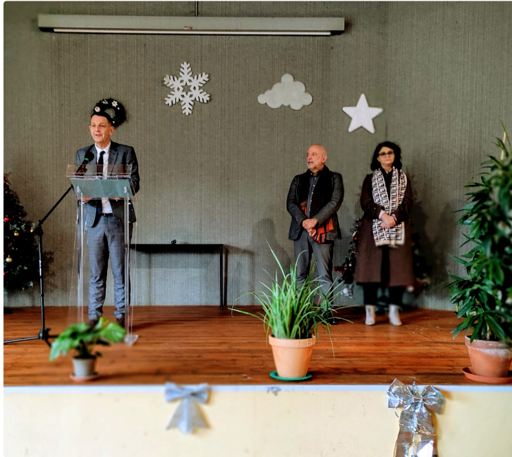
Voeux au Centre Hospitalier du Gers

Une grande partie du personnel a répondu présente à l'invitation de la traditionnelle cérémonie des voeux qui s'est déroulée vendredi matin dans la salle de Loisirs