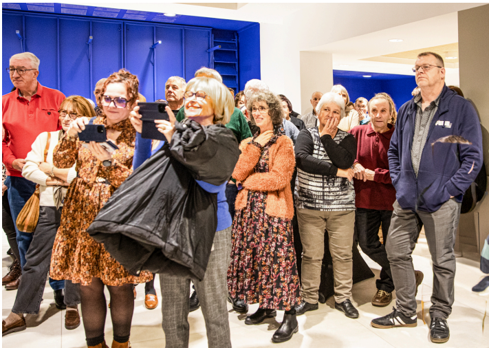
Une partie de l'assistance

Il attire l'attention sur « l'aspect exceptionnel de cette réalisation [la rénovation de la salle des fêtes] pour une petite commune comme la nôtre, mais une commune où réside incontestablement une âme et une passion incommensurable : celle d'une civilisation profondément rurale et attachée à une terre, qui ne s'étouffe pas dans les méandres d'une vision refermée et réductrice, mais produit la racine orgueilleuse et rayonnante des hommes libres qui se tiennent debout face au terrible assommoir de la pensée unique globalisante d'une certaine technostucture urbaine et parisienne, qui ne nous comprend pas, qui ne comprend pas nos us et coutumes, qui ne comprend pas le bon sens paysan en somme ».