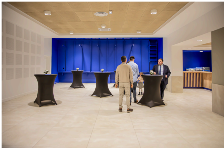
Position du bar dans la salle des fêtes

Puis ce sont des remerciements au cabinet d'architecte BAP qui a dirigé les travaux et à la douzaine d'entreprises artisanales locales qui y ont participé.