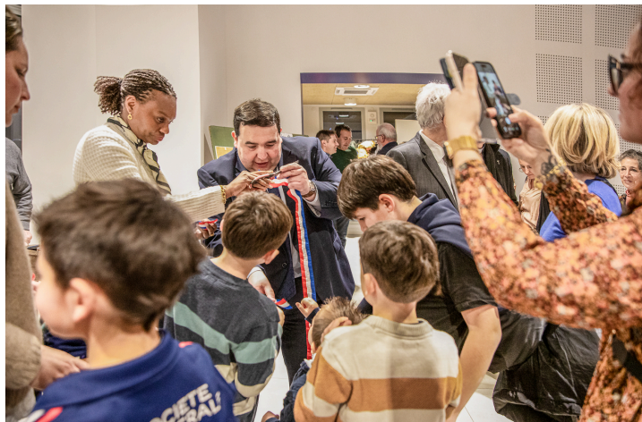
Distribution des morceaux du ruban