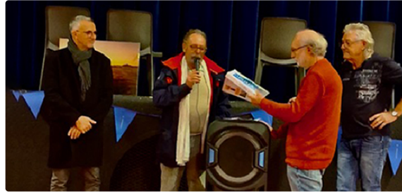
Ca roule toujours aussi bien pour les bleuets mirandais

50 ans sur la route, 50 ans dans le cœur !