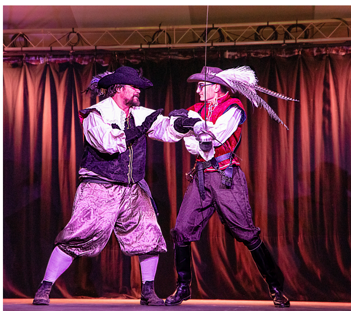
Duel dans un spectacle de cape et d'épée