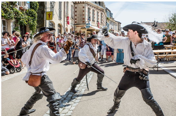
Duel pendant le Festival d'Artagnan