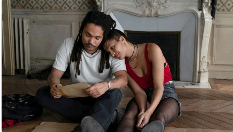
Cinequanon : programme de la semaine avec le dernier Jim Jarmush à l'affiche

Au programme de la semaine, le dernier film de Jim Jarmush, un voyage en Arménie, un drame étrange, un duo d'actrices, horreur et thriller et La femme de ménage pour ceux qui ne l'auraient pas vu !