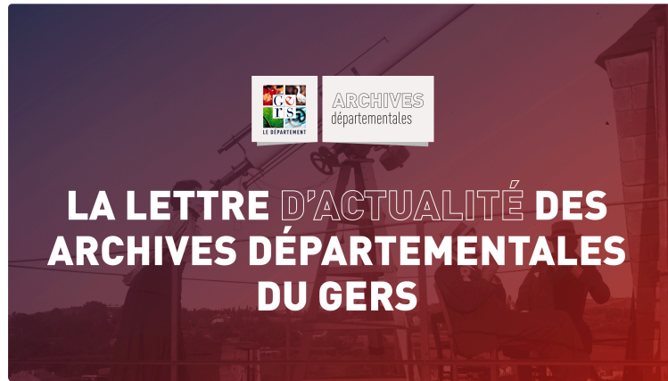
Nouvel agenda des Archives départementales du Gers

Les Archives départementales sont heureuses de vous présenter nouvel agenda culturel (janvier-juin 2026), placé sous le signe des récits sensibles et des découvertes citoyennes.