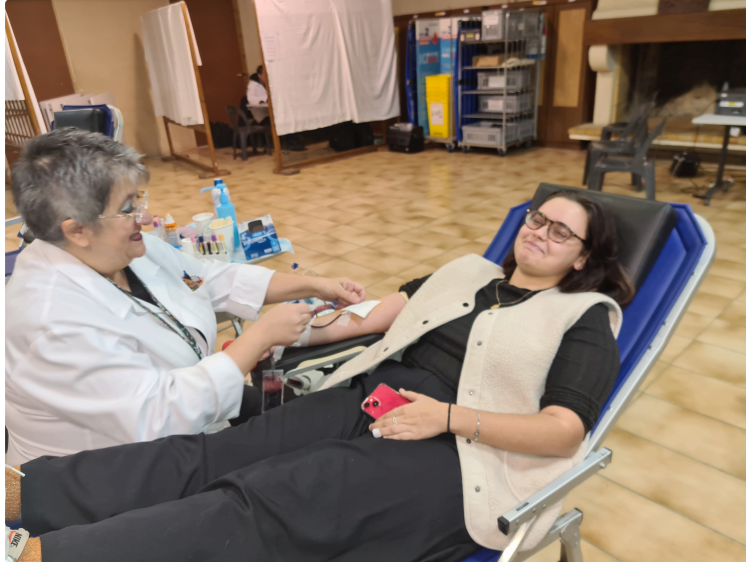
Ma résolution de 2026 : je donne mon sang !

Et si en 2026 la résolution était celle de devenir donneur de sang et/ou de plasma ou de continuer à donner !