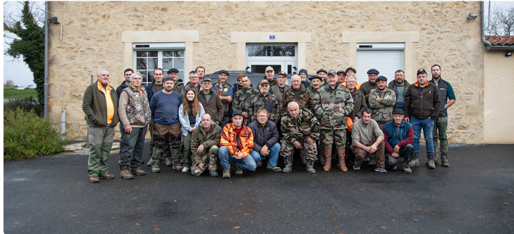
Chasse aux chiens courants traditionnelle de Pouydraguin à Arblade-le-Haut