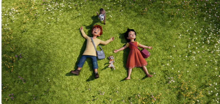
Cinequanon : soirée ciné-nature et goûter de Noël !

Noël arrive et votre cinéma vous propose quelques douceurs pour bien débiter les fêtes ensemble !