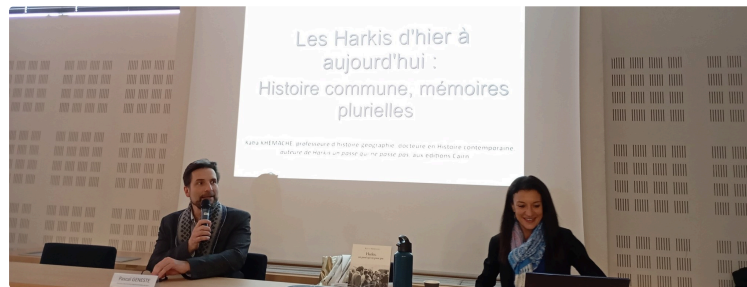
L'histoire des Harkis, sujet d'une conférence exceptionnelle