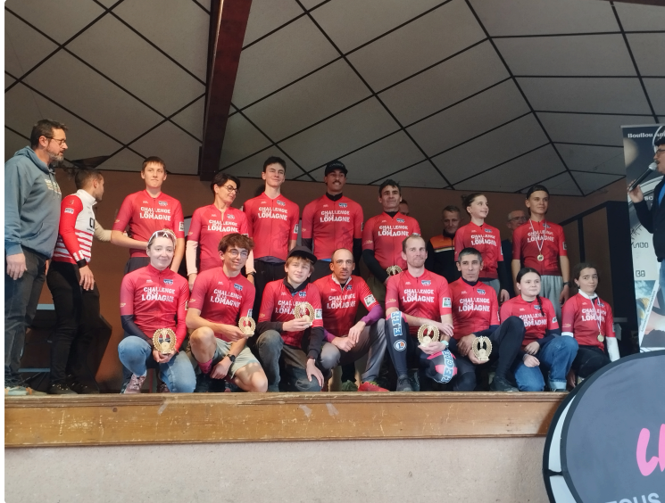
Clap de fin pour le challenge de la Lomagne avec la course de Polastron

Sous un ciel lourd, dans le froid et la boue laissés par les pluies de la veille, la dernière manche du Challenge de la Lomagne UFOLEP VTT s'est disputée ce week-end à Polastron.