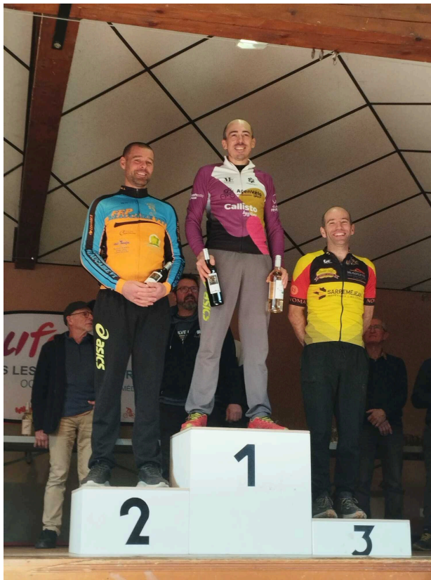
Résultats du Challenge de la Lomagne