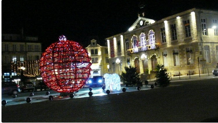
Noël illumine la ville

De nombreuses animations sont prévues du 10 au 24 décembre