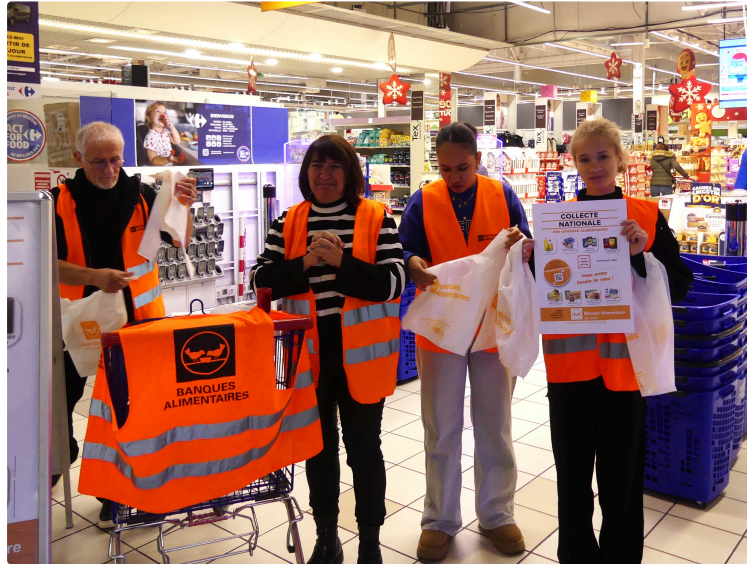
collecte d'automne de la banque alimentaire du Gers

Collecte sur tout le département dans une cinquantaine de magasins alimentaires, 500 bénévoles, 50 tonnes de denrées alimentaire espérées, 10% de plus que la moyenne nationale, près de 10 000 bénéficiaires dans le Gers, 28 associations partenaires . Vous ne pouvez pas aller dans un lieu de collecte vous pouvez donner https://ba32.banquealimentaire.org/mieux-nous-connaître-391