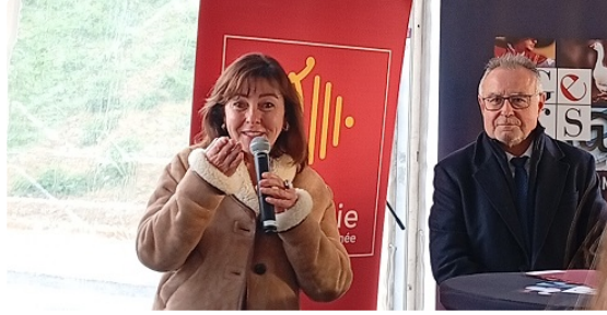
Chantier de mise à 2x2 voies de la RD1124 entre Gimont et L'Isle-Jourdain : ouverture début 2027