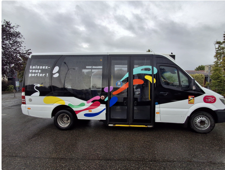
Journée mondiale du transport durable

Pour se rendre au travail, se déplacer pour faire une course, se rendre chez le médecin ou rendre visite à un proche, le choix de notre moyen de transport a un impact sur la planète.