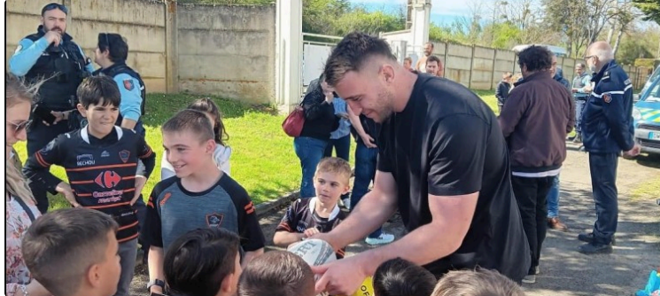
120 ans de l'UAV Rugby : inauguration d'une fresque en l'honneur d'Anthony Jelonch et lancement du "Mur des Amis"

Ce dimanche 30 novembre, à l'occasion du derby très attendu contre Condom - 9e journée de championnat - l'Union Athlétique Vicoise vivra un moment fort de son histoire.