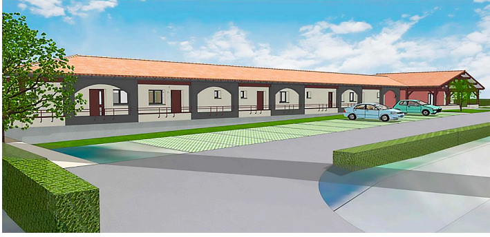
Document de l'architecte