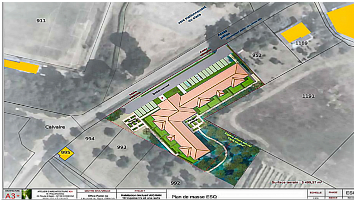
Situation à l'entrée d'Aignan (document de l'architecte)

Toilettes pour personnes à mobilité réduite : 5,93 m 2 .