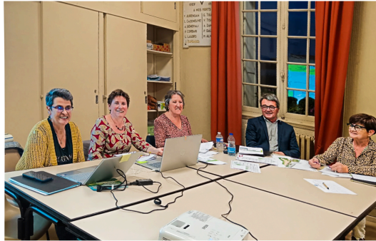
Habitat partagé d'Aignan : la demande de permis de construire est déposée

Pour que les personnes âgées « vivent chez elles sans être seules »