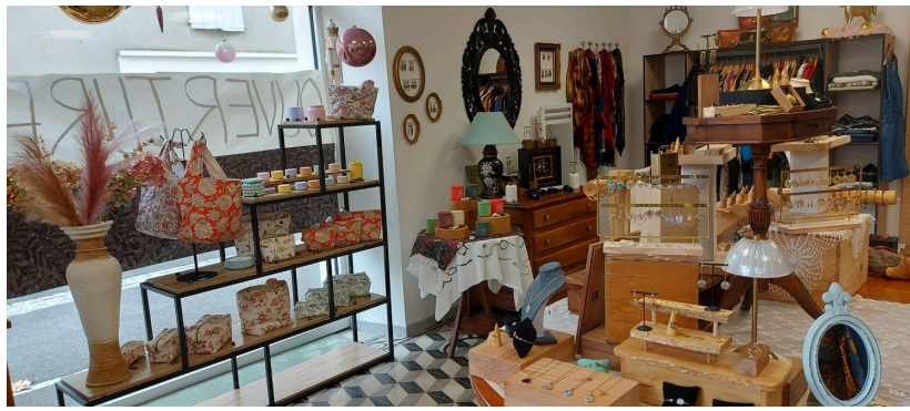
Les bougies naturelles, petites flammes aux parfums de Grasse