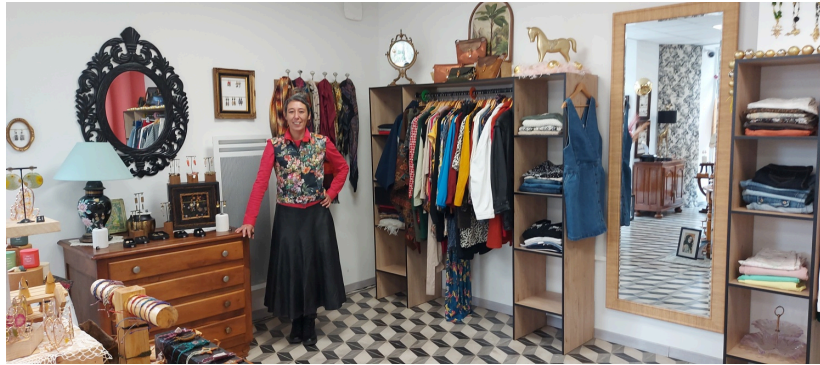
La mode comme un geste tendre

Elle se déplace chez les particuliers, avec sa balance et son œil précis : les vêtements s'étalent sur un lit ou sur une table, elle choisit ceux qui peuvent encore vivre, puis les achète au kilo.